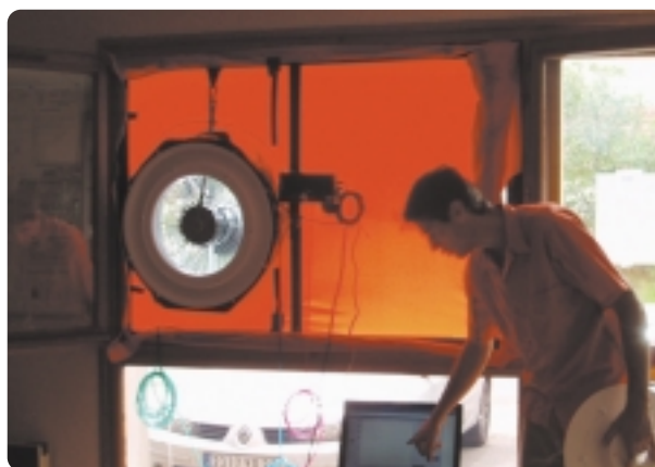
Mesure de la perméabilité à l'air d'un bâtiment par le principe de la porte soufflante («blower door»)